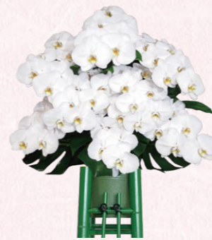
③胡蝶蘭生花(1基) 33,000円(税込)