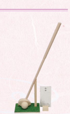
⑤パークゴルフセット