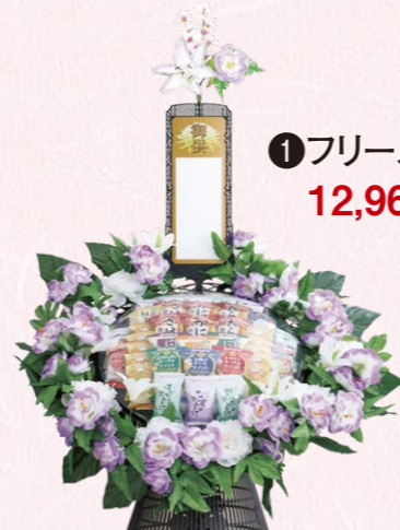
①フリーズドライ(1ケ) 12,960円(税込)