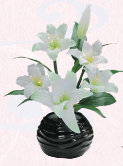
③ルミナス 百合 1台 高さ48cm 16,500円(税込)