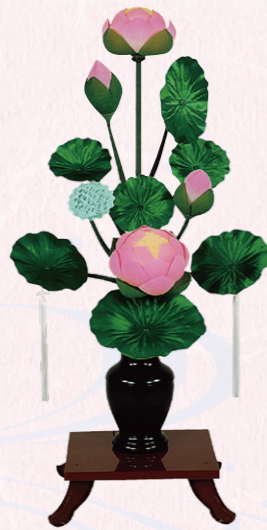
②水葉(すいよう) 1対(2ケ) 高さ110cm 19,800円(税込)