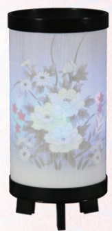
①はなごろも 二重LED 1対(2ケ) 高さ30cm 19,800円(税込)