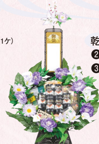
乾物(1ケ) ②19,440円(税込) ③12,960円(税込) ※写真は12,960円(税込) のものです。