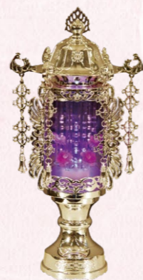
①LEDバブル灯 1対(2ケ) 高さ35cm 19,800円(税込)