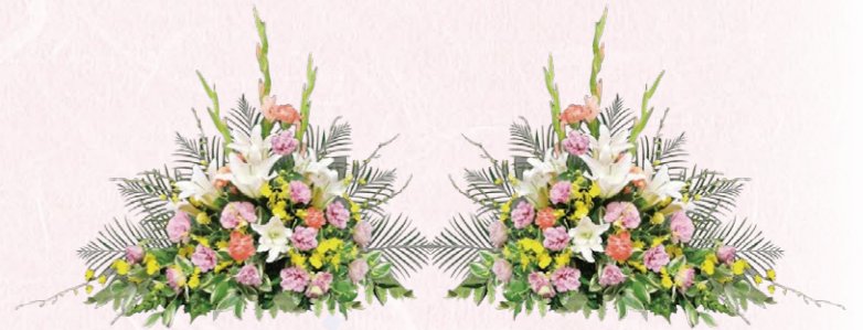
⑧アレンジ花(1対) 16,500円(税込)