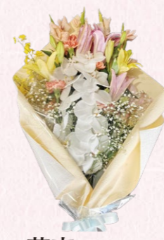
花束(1束) ④11,000円(税込) ⑤7,700円(税込) ※写真は11,000円(税込)のものです。