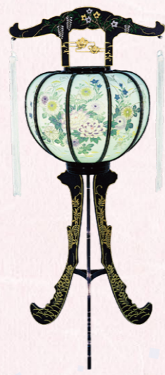
①松山灯 1対(2ケ) 高さ92cm 19,800円(税込)