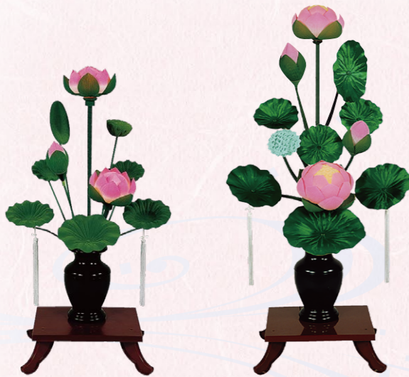
①紫明(しめい) 1対(2ケ) 高さ78cm 13,200円(税込)