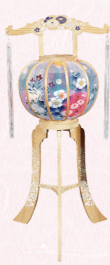
②白木灯 1対(2ケ) 高さ85cm 22,000円(税込)