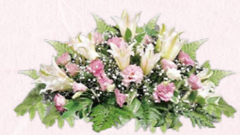
焼香花(1対) ⑥22,000円(税込) ⑦11,000円(税込) ※写真は22,000円(税込)のものです。